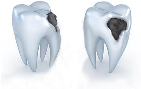
(Imagem de dentes com cáries)